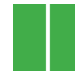
CLS VERNICIATO PAINTED CONCRETE